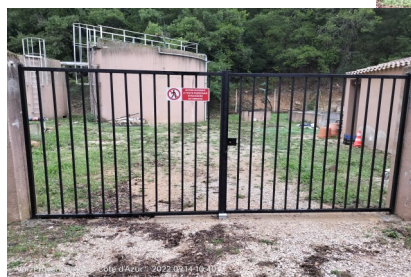
Le portail endommagé a été remplacé